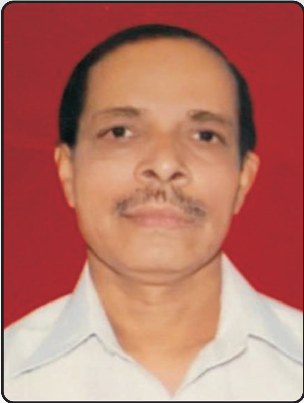
कै.राजशेखर षडाक्षरी पुराणिक