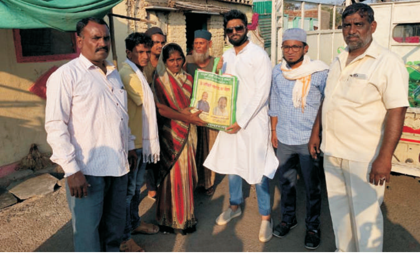
कोरोना काळात गोरगरीबांना किराणा किट व धान्य वाटप करताना अमीर तांबोळी