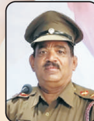
कॅप्टन/उपप्राचार्य संभाजी किर्दाक सर