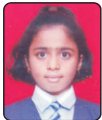
सान्ची नेटके (इ.४ थी) केंद्रात २ रा, जिल्ह्यात १६ वा