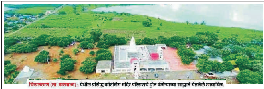
चिखलठाण (ता. करमाळा) : येथील प्रसिद्ध कोटलिंग मंदिर परिसराचे ड्रोन कॅमेऱ्याच्या साहाय्याने घेतलेले छायाचित्र.