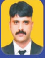
मा.श्री. चषाददा सुर्यबंगी उपाध्यक्ष, दत्तकला शिक्षण संस्था, स्वामी-चिंचोली (भिवगव)