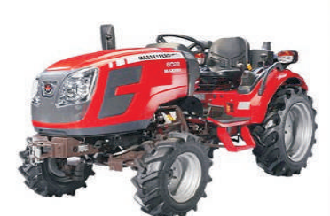
6028 28 (HP)

ऑफर :- कुठलाही नवीन ट्रॅक्टर घेऊन जावा*डाऊनपेमेंट फक्त २१०००/-हजार रुपये सोबत सर्व बँक लोन उपलब्ध. कमीत कमी व्याजदर व शेवटचा हप्ता माफ त्याच बरोबर मेडिकल इन्सुरन्स मिळवा.* हमखास एक भेटवस्तू मोफत मोफत मोफत आजच बुक करा