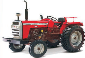
7250 46 (HP)