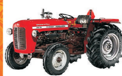
ORCHARD 30 (HP)