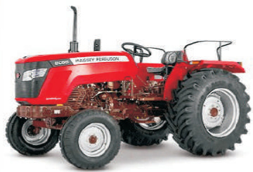
BOSS 50 (HP)