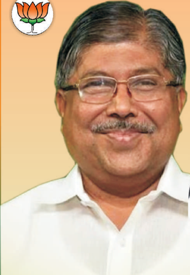
मा.ना.चंद्रकांतजी(दादा) पाटील (मंत्री, उच्च व तंत्रशिक्षण, वस्त्रोद्योग, संसदीय कार्य)