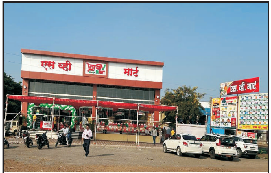
करमाळा येथील कृष्णाजीनगर, बायपास रोड, लोकरे हास्पीटलच्या शेजारी नव्याने सुरु करण्यात आलेल्या एस.व्ही.मार्ट या मॉलचे ८ डिसेंबरला उद्घाटन करण्यात आले. यावेळी सर्व क्षेत्रातील मान्यवर उपस्थित होते. या मॉलमध्ये ग्रासरी, किराणा झायफ्रुट्स, मसाले, प्लॅस्टीक स्टील भांडी तसेच होजिअरी, गारमेंट्स, फुटवेअर, स्टेशनरी आदी प्रकारच्या वस्तू एकाच ठिकाणी उपलब्ध आहेत. भव्य अशा मॉलला नागरीकांनी भेट द्यावी; असे आवाहन एस.व्ही.मॉलच्या टीमने केले आहे.