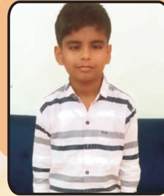
श्लोक वृषभ दुग्गड (O Level 4th Rank)