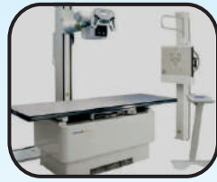
DR Digital X-Ray