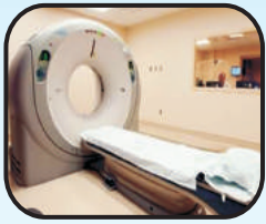
Multislice CT Scan