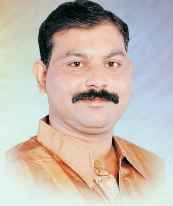
ता.अध्यक्ष, राष्ट्रवादी काँग्रेस पार्टी