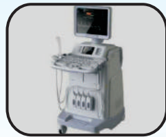
Colour Doppler Sonography