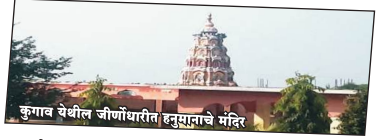
कुगाव येथील जीर्णोद्धारित हनुमानाचे मंदिर