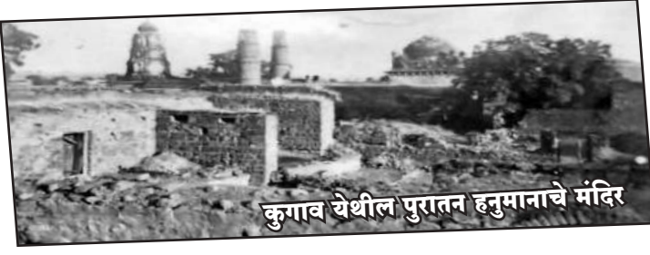
कुगाव येथील पुरातन हनुमानाचे मंदिर